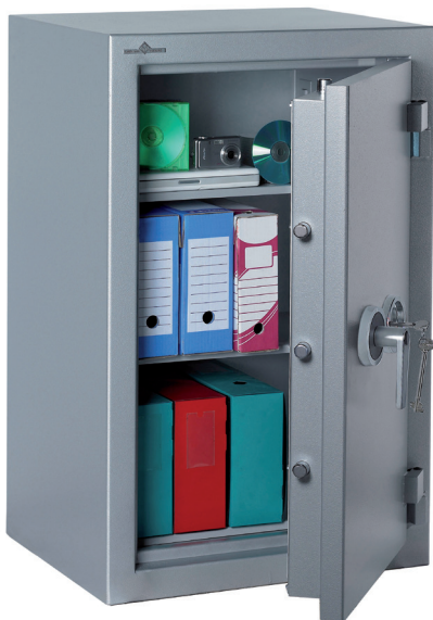
Modèle Zephyr Duo 1149